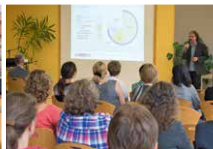
Bilanz-Veranstaltung der Strategie UMMD 2014

Projekte sind auf gutem Wege und werden von den Projektleitern weiterverfolgt. Etwa ein Drittel der Projekte konnte nicht abgeschlossen werden bzw. ist unbearbeitet.