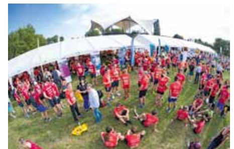
Gruppenfoto der Universitätsmedizin mit etwa der Hälfte der Läufer. Foto oben: Blick auf unseren Pavillon im Elbauenpark