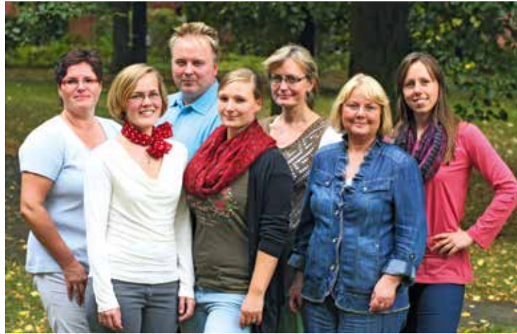
Das Team der Klinischen Studienzentrale

Die Landesärztekammer zertifizierte diese Kurse bislang mit 18 Fortbildungspunkten. Seit November 2010 haben sich an unseren GCP-Kursen insgesamt 241 Teilnehmer beteiligt, dabei halten sich Professoren und Ärzte sowie Study Nurses und andere Mitarbeiter in Studiensekretariaten die Waage. Ein Großteil der Absolventen arbeitet nun in Studienteams mit. Ein guter Anlass, sich bei allen genannten beteiligten Vortragenden und Experten für die jahrelange erfolgreiche Zusammenarbeit zu bedanken.